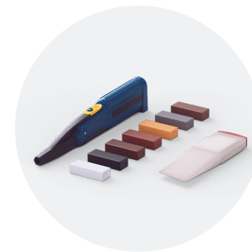
Kit de reparación QSREPAIR