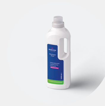
Limpiador de parquet aceitado QSWOILCLEAN