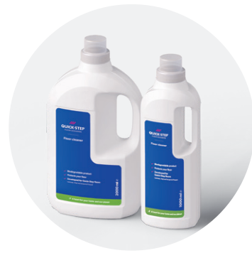
Limpiador de suelos de 1 o 2 l QSCLEANECO1000 QSCLEANECO2000