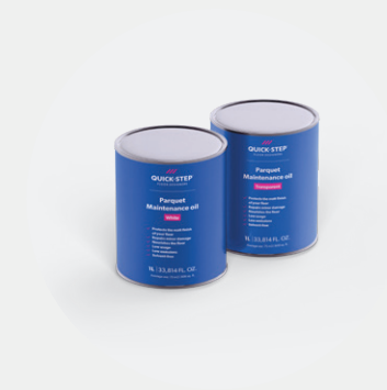
Aceite de mantenimiento de 1 l QSWMAINTOILN / QSWMAINTOILW