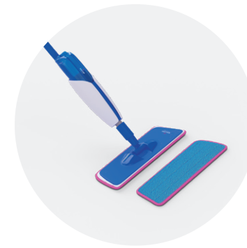
Kit de limpieza QSSPRAYKIT